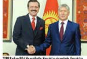
TOBB Başkanı Rifat Hisarcıklođlu, Kırgızistan ziyaretinde, Kırgızistan Cumhurbaşkanı Almazbek Atambayev ile bir araya geldi.