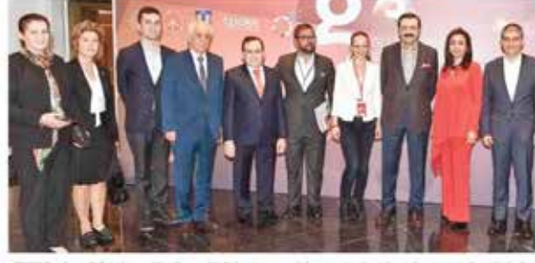
TOBB Başkanı Rifat Hisarcıkloğlu ve Ali Sabancı yuvarlak masa toplantılarında girişimcileri dinledi.

müzde bir sorun olmadığını söyledi. Hisarcıkloğlu "Bu devirde elinizde iyi fikir varsa para verecek olan çok. Yeter ki icat çıkartın, ne yaparsanız yapın yenilikçi yapın. İnsanımızın hamurunda cesaret, cevher var, marifet bunu işlemekte" dedi. Japonya'da her 100 kişiden 5'inin girişimci olduğunu belirten Hisarcıkloğlu "Türkiye'de bu oran yüzde 2. Ülkemizi Japonya seviyesine çıkartabilmek için 2 milyon girişimciye ihtiyacımız var" dedi. •VAŞAR KIZILBAĞ TRABZON