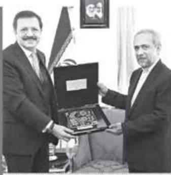
TOBB Başkanı Hisarcıklioğlu, ziyaretinde İran Cumhurbaşkanı Mustafa Kemal Atatürk'le görüşerek, değerlendirmelerde bulundu.

HISARCIKLIOGLU, birçok ülkede İran'la yeni anlaşmalar yapılabileceğini ifade ederken, Başbakan Abant Davutoğlu'nun İran ziyaretinde de çok önemli adımlara varabileceğini Hisarcıklioğlu, "Tahran'da yakinen biletler bittiği vir. Dövizde par bulabiliş çok zor. Bir araziye, kente balya, Rumanya, Azerbayca hayati de vardı. Tam bu heyetle anlaşma imzaları ve bir sahneye çıktılar" dedi.