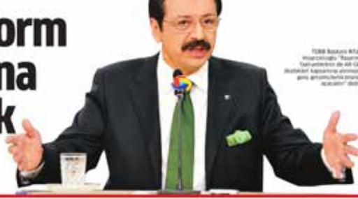
TOBB Başkanı Rifat Hisarcıklıoğlu, "Tasarım faaliyetlerinin de AR-GE kapsamına alınması, AR-GE merkezlerine kapsamlı destekler sağlanacak" dedi.

TOBB Başkanı Hisarcıklıoğlu, mart ayında yürürlüğe girecek AR-GE Reform Paketi'nin inovasyon konuşmaktan inovasyon yapmaya geçiş için çok önemli bir adım olacağını söyledi.