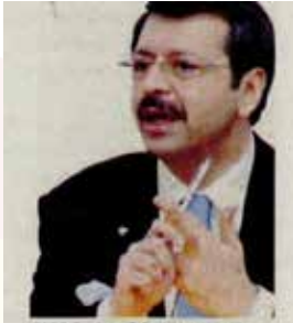
TOBB Başkanı Rifat Hisarcıklioğlu