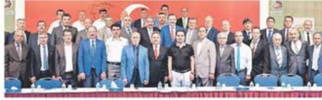
Türkiye Odalar ve Borsalar Birliği (TOBB) 81 il ve 160 ilçedeki oda ve borsa başkanları ile yönetim kurulları eş zamanlı olarak ortak bildiri okudu.