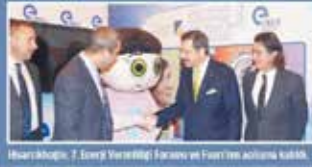
Hisarcıklıoğlu, 7. Enerji Verimliliği Forumu ve Fuarı'nın açılışına katıldı.

Çoğu şirketin enerji stratejisinin bulunmadığına, ancak bunu geliştirmek zorunda olduğuna işaret eden Hisarcıklıoğlu, şirketlere 'operasyonlarını enerjiyi optimize edecek şekilde iyileştirme ve maliyetlerini minimize etme' önerisinde bulundu. "İnsanlığın tüketimine yetişmek için bize 1.5 dünya lazım" diyen Hisarcıklıoğlu "Ben 4. Sanayi Devrimi'nin önceliklere benzemeyeceğini, üretim sürecinin dijitalleşmesinin makinelerin birbiriyle iletişime geçmesinin çok ilerisinde olacağını düşünüyorum" dedi.