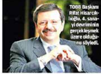
TOBB Başkanı Rifat Hisarcıklođlu, 4. sanayi devriminin gerçekleşmek üzere olduğunu söyledi.