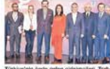
Türkiye'nin önde gelen girişimcileri, Trabzon'daki toplantıda deneyimlerini anlattı.