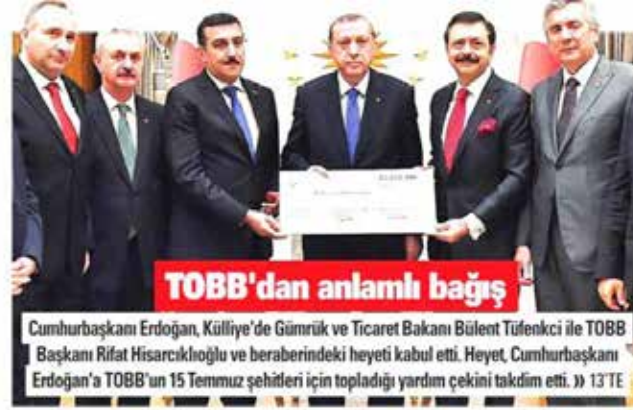
Cumhurbaşkanı Erdoğan, Külliye'de Gümrük ve Ticaret Bakanı Bülent Tüfenkci ile TOBB Başkanı Rifat Hisarcıkloğlu ve beraberindeki heyeti kabul etti. Heyet, Cumhurbaşkanı Erdoğan'a TOBB'un 15 Temmuz şehitleri için topladığı yardım çekini takdim etti. » 13 TE