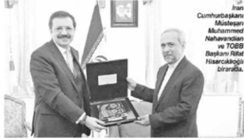
İran Cumhurbaşkanı Müsteşarı Muhammed Nahavandian ve TOBB Başkanı Rifat Hisarcıklioğlu birarada.

İran'a "Komşu ülkenin iş dünyası olarak daha fazla ekonomik işbirliğine varız" mesajını ileten Hisarcıklioğlu, açıklamasında, "İran hem komşumuz hem de doğal ticari partnerimiz. Türk ve İran şirketleri daha fazla ticaret, yatırım ve üçüncü ülkelerde birlikte iş yapabilir. Bu potansiyel mevcut. Bunun için bir dizi temaslarda bulundum" ifadelerini kullandı.