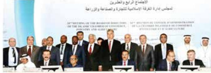
İslam Ticaret, Sanayi ve Tarım Odası (ICCIA) İslam ülkeleri temsilcileri, Konya'da bir araya geldi. TOBB Başkanı Hisarcıkloğlu ile Suudili işadamı ve Al Baraka Bankası'nın sahibi olan Şeyh Saleh Kamel birlikte.

İslam ülkelerinin temsilcileri, Konya'da bir araya geldi. TOBB Başkanı Hisarcıkloğlu, "İslam ülkeleri dünya doğalgaz rezervlerinin % 57'sine, petrolün % 69'una toplam zenginliğin ise sadece % 12'sine sahip. Zenginlikte tek başına ABD'nin payı bile % 19'dedi.