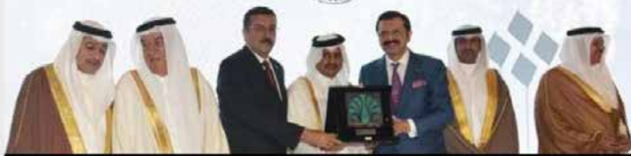
Bakan Tüfenkci ve TOBB Başkanı Hisarcıkıoğlu, Bahreyn'de yatırımcılarla bir araya geldi.

Türkiye'den 250 kişilik heyetin katıldığı forumda, çeşitli ülkelerden 300'e yakın firma ile bu ülkelerde faaliyet gösteren 60 Türk firması da yer aldı. Forumda konuşan Gümrük