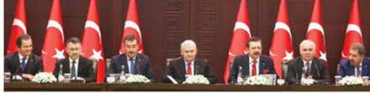
'KOBİ'ler için Nefes Kredisi' Başbakan Binali Yıldırım ile Gümrük ve Ticaret Bakanı Bülent Tüfenkci katıldığı toplantıyla 2 Aralık'ta tanıtıldı.

TOBB öncülüğünde hayata geçirilen 'KOBİ'ler için Nefes Kredisi' projesine başvurular başladı. KOBİ'ler Ziraat ve Denizbank'tan yıllık % 9.90 faizle 1 yıl vadeli kredi alabilecek.