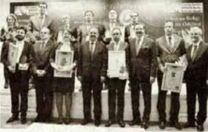
Türkiye'de seçilen en çevreci şirketler, 27 Ekim'de Estonya Tallinn'de yapılacak yarışmaya katılacak.