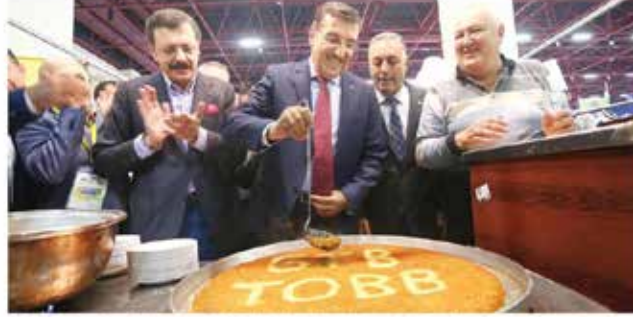
7. Yöresel Ürünler Fuarı (YÖREX) Antalya EXPO Center'da acildi. Açılışa katılan Gümrük ve Ticaret Bakanı Bülent Tüfenkci (ortada) ve TOBB Başkanı Rifat Hisarcıkılıođlu (solda) stantları gezerken künefenin şerbetini de döktü.

ANTALYA'DA düzenlenen Yöresel Ürünler Fuarı (YÖREX), Gümrük ve Ticaret Bakanı Bülent Tüfenkci ve TOBB Başkanı M. Rifat Hisarcıkılıođlu'nun katılımıyla dün başladı. Türkiye'nin her bölgesinden yöresel ürünleri aynı çatı altında buluşturan fuarda 'yöresel ürününü marka yapan, parayı kazanır' vurgusu yapıldı. Fuarın açılışında konuşan Gümrük ve Ticaret Bakanı Bülent Tüfenkci "Sadece Türkiye içinde fuar