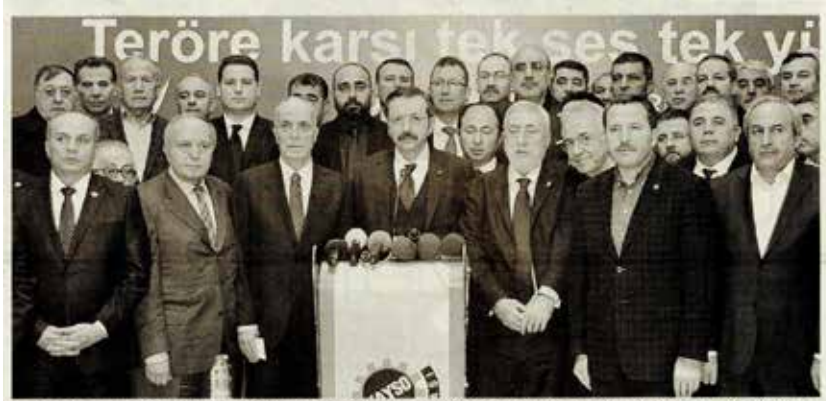
Terör saldırısının meydana geldiği yeri ziyaret eden heyettekiler, şehitler için çiçek ve bayrak bıraktıktan sonra dua okudular. Heyet, 11. Cumhurbaşkanı Abdullah Gül ile de görüşerek, başsağlığı dileklerini ilettiler ve ülkenin acısını paylaştılar.