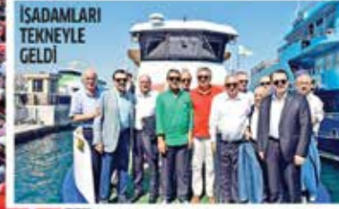
İşadamları, işçi temsilci ve üyelerin katılımıyla düzenlenen mitingde, başbakanın yanına aynı tekneye çıktılar.

T ÜRKİYE dün Demokrasi ve Şehitler Mitingi'ni düzenlediği Yenikapı'ya akın ederken tarihi mitinge iş dünyasının önde gelen temsilcileri de katıldı. İş dünyasının önde gelen sivil topluma örgütlerinin başkanları Yenikapı'ya aynı tekneyle çıkarma yaptılar. Türkiye'nin birlik ve bütünlüğünü aynı tekneye binerek simgeleyen başkanlar elinde bayraklarla demokrasiye olan inançlarını mahşeri kalabalıkla birlikte haykırdılar.