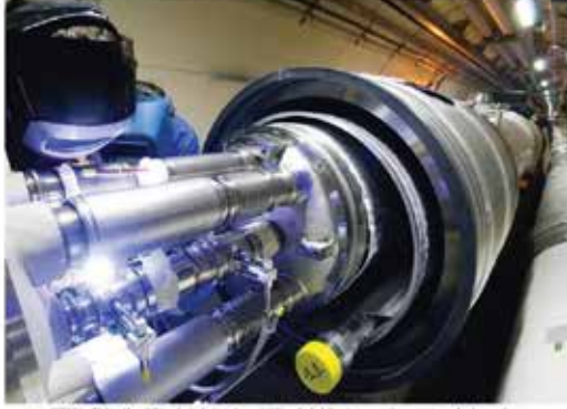
CERN'de, katıyeten 200m fazla üniversite ve 200den fazla bilim insanı proje ve araştırmaları yapıyor.