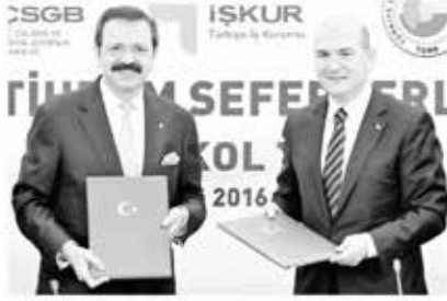
Mesleki eğitim ve istihdam seferberliği başlatılan protokole TOBB Başkanı M. Rifat Hisarcıkılıoğlu ve Çalışma ve Sosyal Güvenlik Bakanı Süleyman Soylu imza attı.

TÜRKİYE Odalar ve Borsalar Birliği (TOBB) Başkanı Rifat Hisarcıkılıoğlu, Türkiye’de çalışma verimi konusunda yaşanan sıkıntılara dikkati çekerek, “Bizde bir çalışan bir saatte 30 dolarlık milli gelir üretiyor. Ekonomik Kalkınma ve İşbirliği Örgütü (OECD) ortalaması 45 dolar. Almanya’da 60 dolar. Farkın temel nedeni iyi eğitilmiş ve vasıflı iş gücüdür” dedi. Çalışma ve Sosyal Güvenlik Bakanlığı (ÇSGB), Türkiye İş Kurumu Genel Müdürlüğü (İŞKUR) ve TOBB arasında “Mesleki Eğitim ve İstihdam Seferberliği” protokolü imzalandı. Bakanlıktaki imza töreninde konuşan Hisarcıkılıoğlu, Fethullahçı Terör Örgütü’nün (FETÖ) 15 Temmuz darbe girişiminin ardından artık ekonomiyi normalleştirme ve somut adım atma zamanının geldiğini belirterek, “Özellikle de böyle bir dönemde istihdam alanlarında ekonomiyi tanıtmak çok daha önemli hale geldi” diye konuştu.