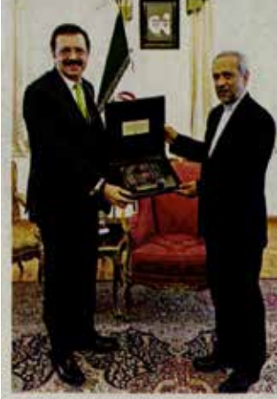
TOBB Başkanı Rifat Hisarcıkloğlu (sola), İran Cumhurbaşkanı Müsteşarı Muhammed Nahavandian ile görüşüp ve kendisine bir plaket sundu.

İran pazarının rakiplere kaptırılmaması gerektiğini belirten TOBB Başkanı Rifat Hisarcıkloğlu, "Tahranda dikkati çeken en önemli yenilik, yabancı heyet bolluğu, İran, ticari ilişkilere pozitif bakıyor ve Türkiye ile birlikte çalışmayı arzuluyor" dedi