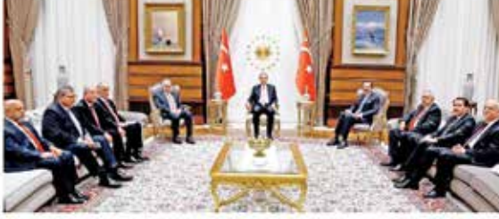
Cumhurbaşkanı Recep Tayyip Erdoğan, TOBB, TOSİ, Türk-İş, TZOİB, Memur-Sen, Kamu-Sen, Hak-İş, TİSK'nin başkanlarını kabul etti. Kabulde, kara propagandaya karşı STK'ların yurtdışı faaliyetlerini artırması üzerinde duruldu.

BAŞTA Türkiye Odalar ve Borsalar Birliği (TOBB) olmak üzere Türkiye'de faaliyet gösteren sivil toplum kuruluşları, darbe girişimi sürecince yaşananların yurtdışında çarpıtılmaması için harekete geçti. TOBB, TESK, Türk-İş, TZOİB, Memur-Sen, Kamu-Sen, Hak-İş, TİSK darbe sürecindeki bilgi kirliliğinin önlenmesinde etkin rol alacağını açıkladı. Ayrıca Türkiye'de faaliyet gösteren yabancı şirketlerin CEO'ları da kendi ülkelerinde darbe girişimi sürecini anlatacaklar. Cumhurbaşkanı Recep Tayyip Erdoğan, Türkiye-AB Karma İstişare Komitesi (KİK) üyesi kuruluşların temsilcilerini kabul etti. Edinilen bilgilere göre Cumhurbaşkanı Erdoğan, devlet içindeki Fethullahçı Terör Örgütü (FETÖ) yapılanmasıyla mücadelenin devam edeceğini dile getirdi.