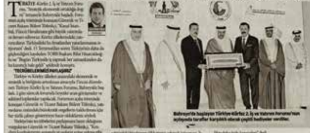
Bahreyn'de düzenlenen Türkiye-Körfez 2. İş ve Yatırım Forumu'nun açılışında bakanlar katılımcılarla birlikte fotoğraf çektiriyor.

Gümrük ve Ticaret Bakanı Bülent Tüfenkci, Bahreyn'de süren İş ve Yatırım Formu'ndaki konuşmasında Türkiye'nin 15 Temmuz sonrasında daha güçlü hale geldiğini ve yatırımın daha kazançlı olduğunu belirtti. TOBB Başkanı Rifat Hisarcıklıoğlu ise Körfez sermayesi ile Türkiye'nin birlikte kazanç elde edebileceğini vurguladı.