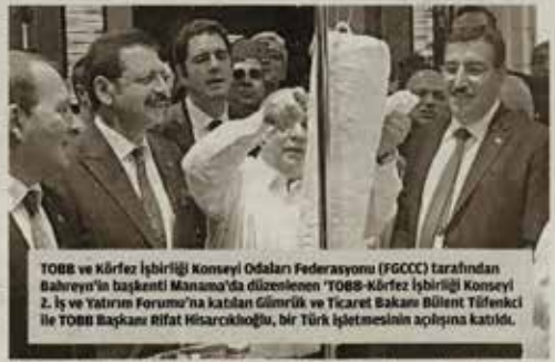
TOBB ve Körfez İşbirliği Konseyi Odaları Federasyonu (FGCC) tarafından Bahreyn'in başkenti Manama'da düzenlenen 'TOBB-Körfez İşbirliği Konseyi 2. İş ve Yatırım Forumu'na katılan Gümrük ve Ticaret Bakanı Bülent Tüfenkci ile TOBB Başkanı Rifat Hisarcıklıoğlu, bir Türk işletmesinin açılışına katıldı.

'GÖRÜŞMELER ÖLÜMLÜ' Türkiye-Körfez 2. İş ve Yatırım Forumu'ndan sonuçlandırılan ilk toplantı olan Gümrük ve Ticaret Bakanı Bülent Tüfenkci, "Biliyorsunuz, gerçekleştirilen görüşmeler verimli sonuçlar elde ettik. Bunun da iş adamlarımızla Körfez'den gelen yatırımcıların buluşmasını önemli bir adım olarak görüyoruz. Bu anlamda önemli görüşmeler gerçekleştirildi. TOBB Başkanı 290 İş Adamları Buluşması gerçekleştirildi, bunların için 300 Körfez İş Adamları Buluşması ve ticaretin gelişmesini sağlamakla önemli görüşmeleri zaman zaman gerçekleştireceğiz görüşmelerimiz var. Her iki tarafta da Körfez ülkelerinde gerçekleştirilen görüşmeler, iş yapma noktasında önemli adımlar atıldı. TOBB Başkanı ile Körfez İş Adamları Buluşması gerçekleştirildi."