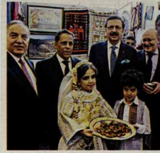
TOBB Başkanı Rifat Hisarcıkıoğlu, 2. Afrika Günü Kutlamaları çerçevesinde düzenlenen, "Afrika Turizmi: Kültür ve Miras" konulu toplantıya katıldı. Başkan Rifat Hisarcıkıoğlu, toplantının ardından ülkelerin standlarını ziyaret etti.