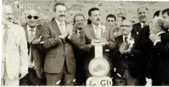
TOBB, İran'a açılan Kapıköy Gümrük Kapısı'nı 70 milyon TL yatırımla modernize edecek.