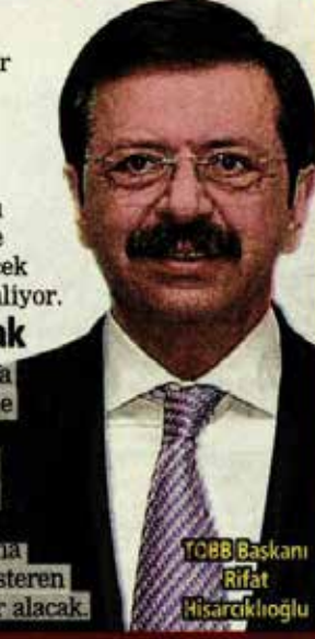
TOBB Başkanı Rifat Hisarcıklıoğlu

Bahreyn Başbakanı Şeyh Khalifa bin Salman Al Khalifa himayesinde gerçekleştirilecek foruma TOBB Türkiye'den 250 kişilik bir heyetle gidilirken, Bahreyn, Birleşik Arap Emirlikleri, Katar, Kuveyt, Oman ve Suudi Arabistan'dan da 300 firma katılacak. Bu ülkelerde faaliyet gösteren 60 Türk firması da iş forumunda yer alacak.