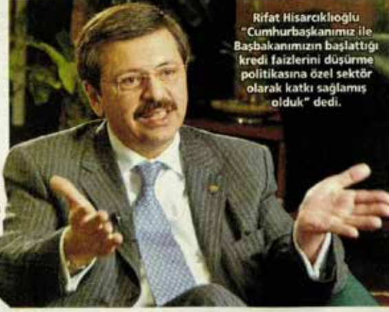
Rifat Hisarcıkıoğlu "Cumhurbaşkanımız ile Başbakanımızın başlattığı kredi faizlerini düşürme politikasına özel sektör olarak katkı sağlamış olduk" dedi.