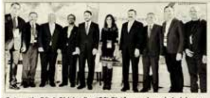
Geleceğin Gücü Girişimciler (G3) Platformu deneyimlerini genç girişimcilere aktardı. G3 Forumu her yıl 4 bölgede yapılacak.