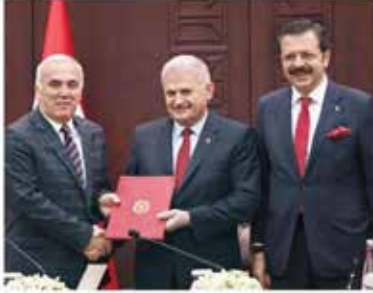
Projeun TOBB'un Ziraat Bankası destek üyesi.

■ Başbakan Yıldırım, "KOBİ'ler için Nefes Kredisi"ni tanıttı. Küçük işletmelere aylık 0,83, yıllık 9,90 faizle, 1 yıl vadeli kredi sağlayacak proje, üç ay içinde 80 bin KOBİ'nin derdine ilaç olacak. Devrim niteliğindeki adım, hâlen yüzde 15 ile 18 arasında faizle kredi kullanan KOBİ'lerin yüzünü güldürecek. 7'DE