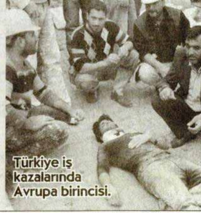
Türkiye iş kazalarında Avrupa birincisi.