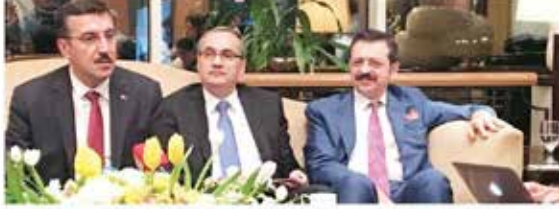
Gümrük ve Ticaret Bakanı Bülent Tüfenkci (ortta) ve TOBB Başkanı Rifat Hisarcıklıoğlu (sağda), Bahreyn'de is forumuna katıldı.

KÖRFEZ İktisadi Konseyi Elektrik Bağlantıları CEO'su Ahmed Al Chrabat, enerji sübvansiyası elektrikle bağlı olarak gün geçtikçe geliştirildiğini belirtirken "Körfez ülkeleri petrol ve doğal gazı taşıyıcı kalmaktaydı. Başarılı gas ve nakiller gibi onları da içine alarak" dedi. Körfez Elektrik Bağlantı Projesiyle 2025 yılında küresel enerji arzı için İbradim, Irak, Ürdün, Mısır ve Türkiye'ye varabilecek kadar güç üretecek. Türkiye Avrupa kıtasına açılan bir kapı. Üstün vadelerde enerji ihracatı Türkiye (örneğin Aralık) ülkelerine tamamıyla planlanıyor" dedi.